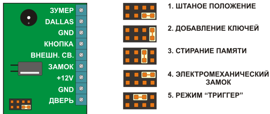
Рис. 2. Конфигурация джамперов

Режим «Ассерт» применяется для записи всех подносимых к считывателю ключей DS1990A. В данном режиме, от ключа, подносимого к считывателю, происходит срабатывание на открывание двери и одновременно ключ записывается в память контроллера. Режим используется для восстановления базы пользователей без сбора ключей клиентов. Для включения режима необходим мастер-ключ. Пять раз кратковременно поднесите мастер-ключ к считывателю. В момент каждого касания, контроллер выдает сигналы, подтверждающие опознание мастер-ключа, а их количество будет соответствовать количеству касаний. В момент пятого касания, контроллер выдаст соответственно пять сигналов и ещё один длинный сигнал, подтверждающий переход в режим «Ассерт». Для выхода из режима поднесите мастер-ключ. Раздастся сигнал о выходе, серия коротких сигналов. При пропадании напряжения питания, установленный ранее режим «Ассерт*» сохраняется и после включения напряжения.